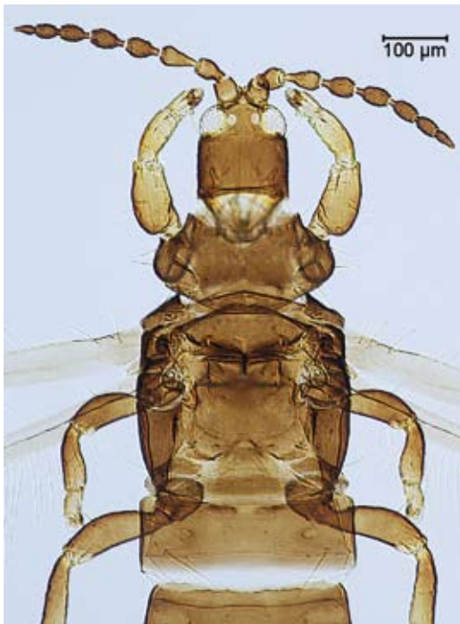
Abbildung 7. Tylothrips osborni ♀ f.m. (D-33/1). Kopf und Thoraxbereich, dorsal.

Fundort: Ortenberg, Waldrand beim Wanderparkplatz: 1♀f.m. (D-33) am 12.07.2012 an abgestorbenen, aufgeschichteten Weinstöcken ( Vitis vinifera ), die zum Teil mit Urtica dioica [Große Brennnessel] durchwuchert waren. Der Fundort liegt in unmittelbarer Nähe eines Baches und ist recht feucht.