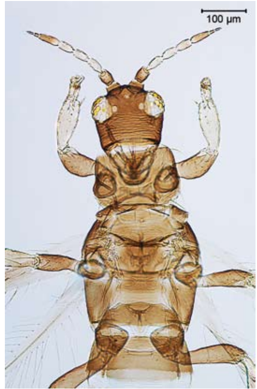
Abbildung 1. Iridothrips mariae ♀ (D-14/4). Kopf und Thoraxbereich, dorsal. – Alle Abbildungen: M. R. ULITZKA.

Monophag unter Blattscheiden von Typha angustifolia [Schmalblättriger Rohrkolben] und T. latifolia [Breitblättriger Rohrkolben], zeitweise unter der Wasseroberfläche. Ernährung: Phytophag. Verbreitung: Östliches Mitteleuropa (Polen,